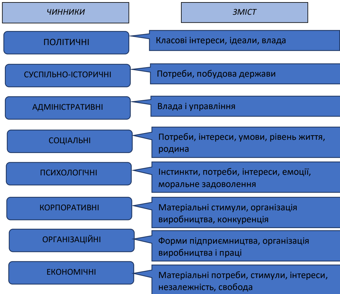
Рис. 3. Схема мотивів підприємницької діяльності.

Таким чином, однією з ознак, за якими класифікуються підприємства, є чисельність працівників і обсяг господарського обороту відповідно до якої виділяють такі підприємства: великі; середні; малі. Здійснювати малу підприємницьку діяльність можуть громадяни України, інших держав, не обмежені законом у правоздатності або дієздатності та юридичні особи всіх форм власності, встановлених Законом України «Про власність». Якщо розглядати мотивацію як систему, яка спонукає до розвитку господарської діяльності, то можна виділити такі її чинники (рис.3).