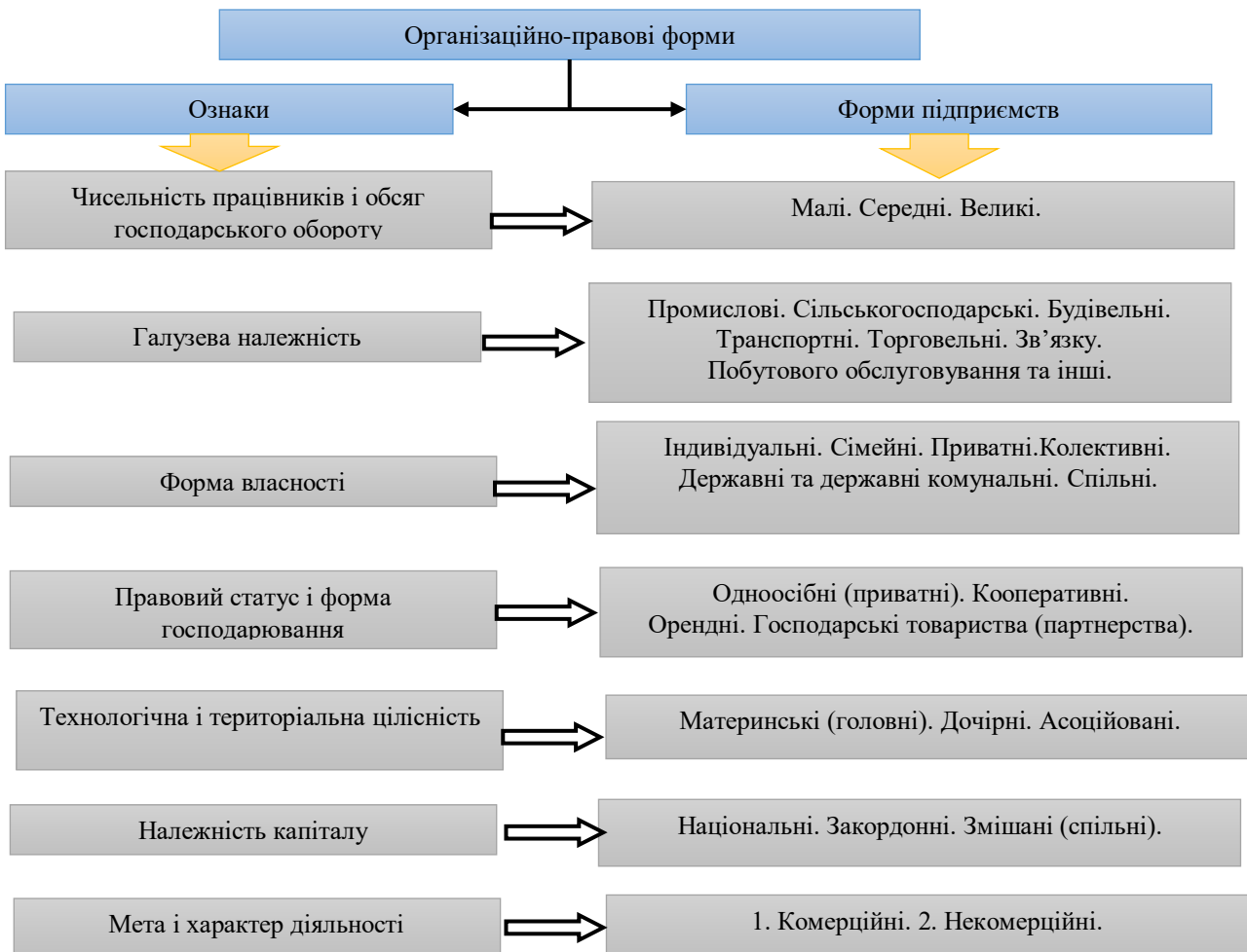
Рис. 2. Організаційно-правові форми підприємств

Однак можна виділяти певні основні ознаки, за якими доцільно класифікувати всі організаційно-правові форми підприємств (рис.2).