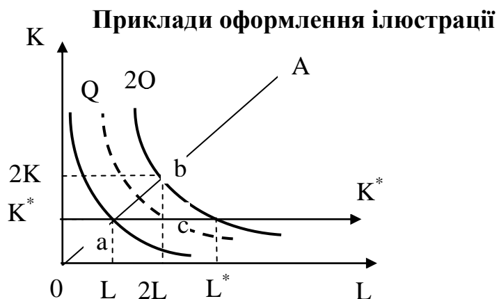
Рис. 1.2. Спадаюча віддача змінного ресурсу при постійній віддачі від масштабу