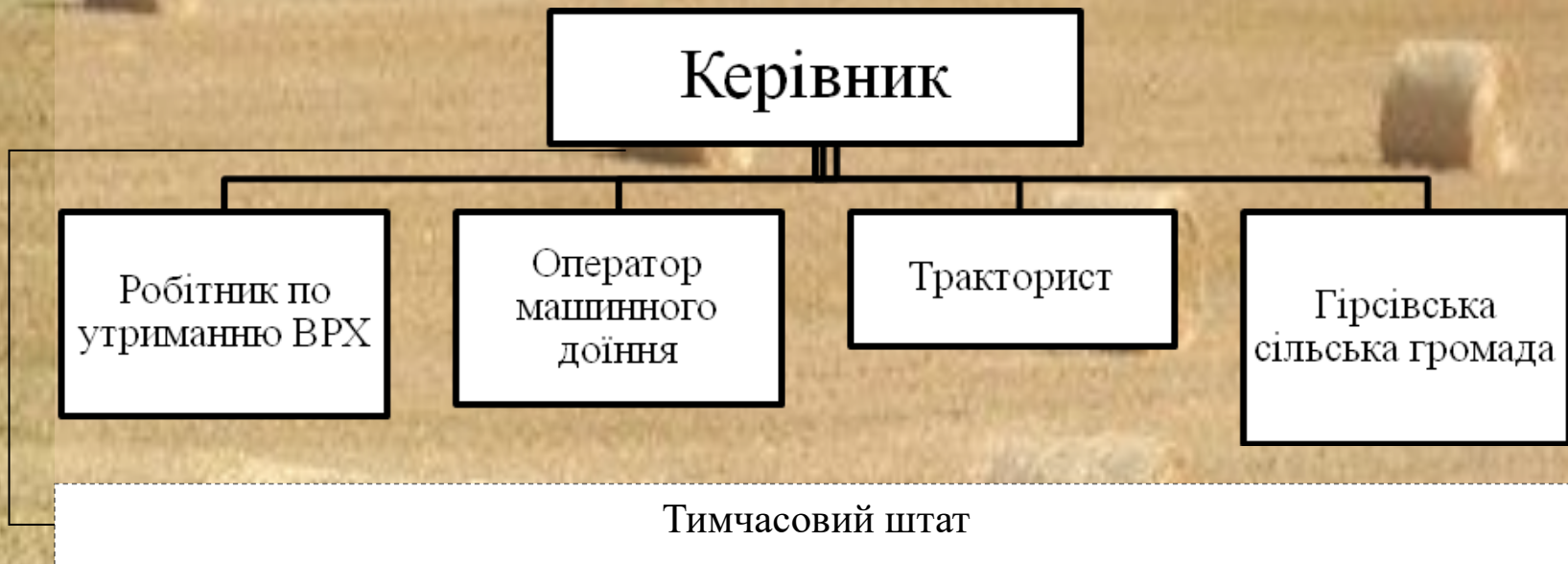
Рис. 1 - Матрична організаційна структура проекту зі створення сімейної ферми