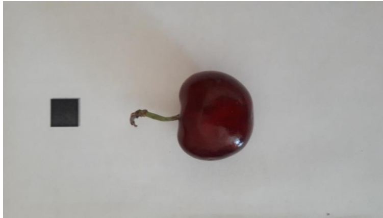
Рис. 1. Фотозображення об'єкту

Третій етап – виконання операцій «відтінки сірого» та «бінаризація», в результаті яких вхідне зображення спочатку конвертується в градації сірого кольору, а потім – у чорно-біле зображення. Операції «відтінки сірого» та «бінаризація» виконується за допомогою вбудованої в бібліотеку OpenCV функції CvFindContours() [3], заснованої на алгоритмі SUZUKI85 [4].