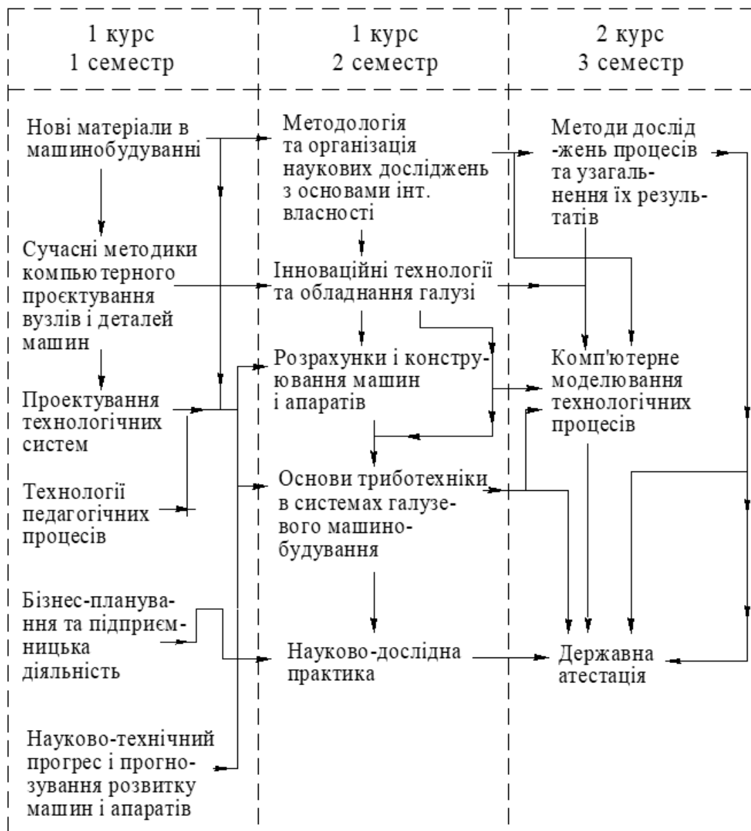
Рисунок 2.1 - Структурно-логічна схема освітньо-професійної програми «Галузеве машинобудування» другого (магістерського) рівня вищої освіти

Структурно-логічну схему освітньо-професійної програми представлено на рисунку 2.1.