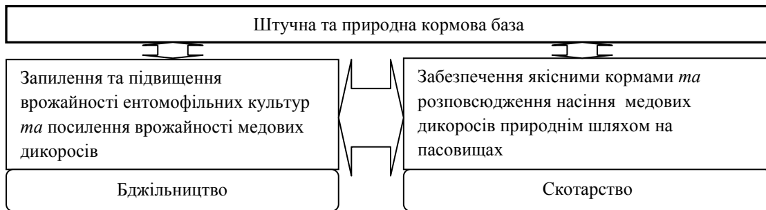
Рисунок 1 – Задіяння принципу біфуркації на конкретному прикладі

У якості доведення оптимальності вибору бджільництва на засадах біфуркації може виступити простий приклад – через кормову базу для скотарства, заснованої на багаторічних травах та природних пасовищах та луках, що підсилені точковим підсівом дикорослих медоносів, можна в повному обсязі досягти принципу біфуркації у формуванні економічних результатів завдяки задіянню одного з елементів виробничої системи за двома напрямками одночасно, без додаткових витрат (рис. 1).