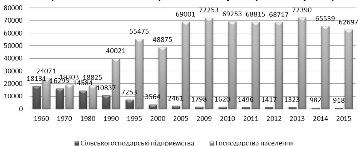
Рисунок 2 – Динаміка виробництва меду в Україні за категоріями господарювання, т.

Цифри з виробництва меду обчислюються на базі зведених оцінок. На сьогодні офіційна статистика з виробництва меду в Україні наступна (рис. 2).