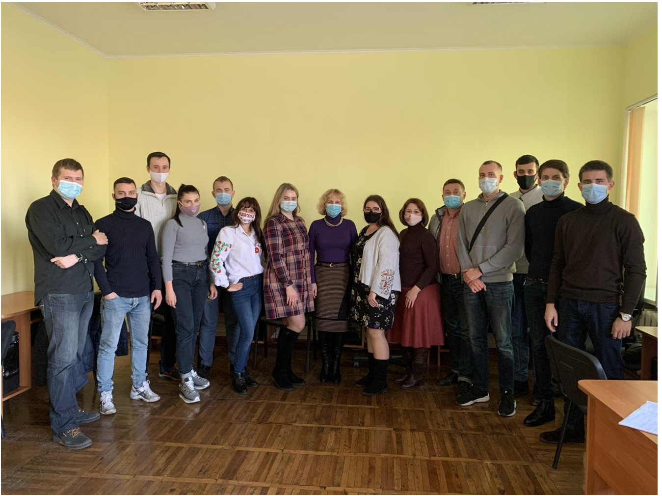
Рис. 6. Складання заліку з дисципліни «Українська мова в науці» аспірантами 1-го року навчання, 26.11.2020 р.