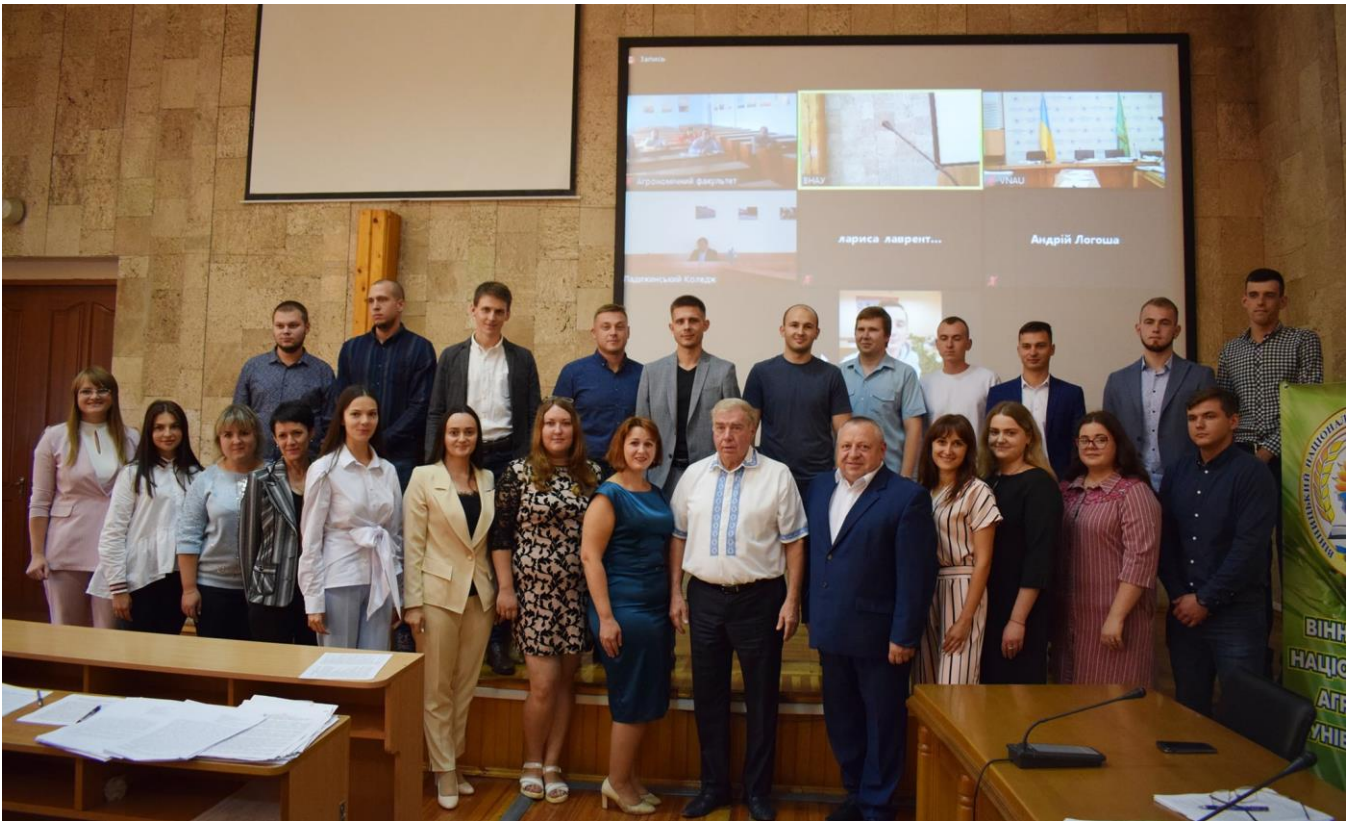
Рис. 1. Затвердження тем дисертаційної роботи та призначення наукових керівників