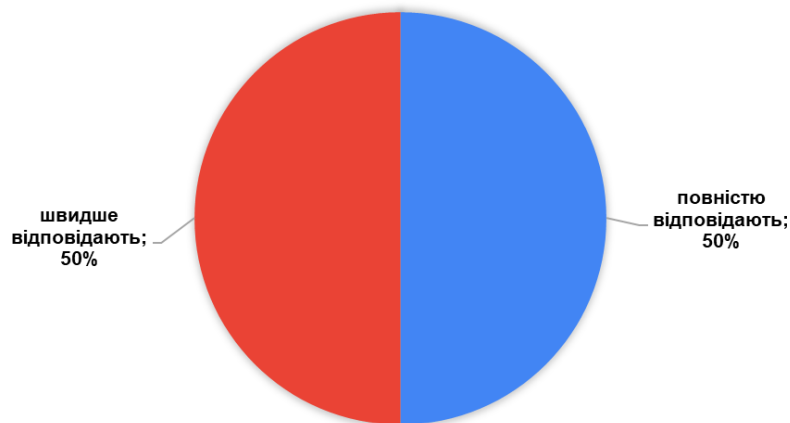
Рис. 1. Оцінювання « Наскільки знання випускника зі спеціальності відповідають сучасному реальному стану виробництва і бізнесу » (у відсотках)

Результати ранжування тринадцяти найбільш важливих компетентностей випускника для роботи за фахом ( 1- найбільш важлива ) представлено у табл. 1.