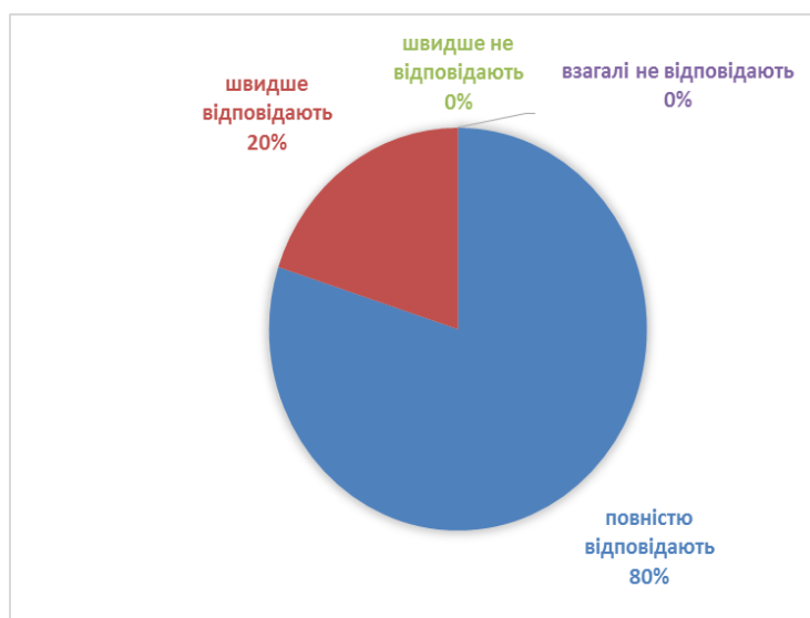
Рис. 1. Оцінювання «Наскільки знання випускника зі спеціальності відповідають сучасному реальному стану виробництва і бізнесу» (у відсотках)

Результати оцінювання науково-педагогічними працівниками якості ОПП «Цивільна безпека» за критерієм «Наскільки знання випускника зі спеціальності відповідають сучасному реальному стану виробництва і бізнесу» наведено на рисунку 1.