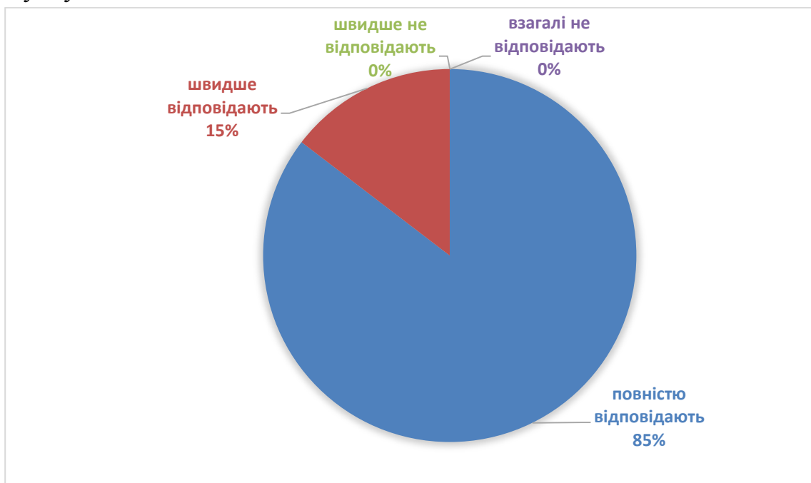
Рис. 1. Оцінювання «Наскільки знання випускника зі спеціальності відповідають сучасному реальному стану виробництва і бізнесу» (у відсотках)

Результати оцінювання науково-педагогічними працівниками якості ОПП «Економіка» за критерієм «Наскільки знання випускника зі спеціальності відповідають сучасному реальному стану виробництва і бізнесу» наведено на рисунку 1.