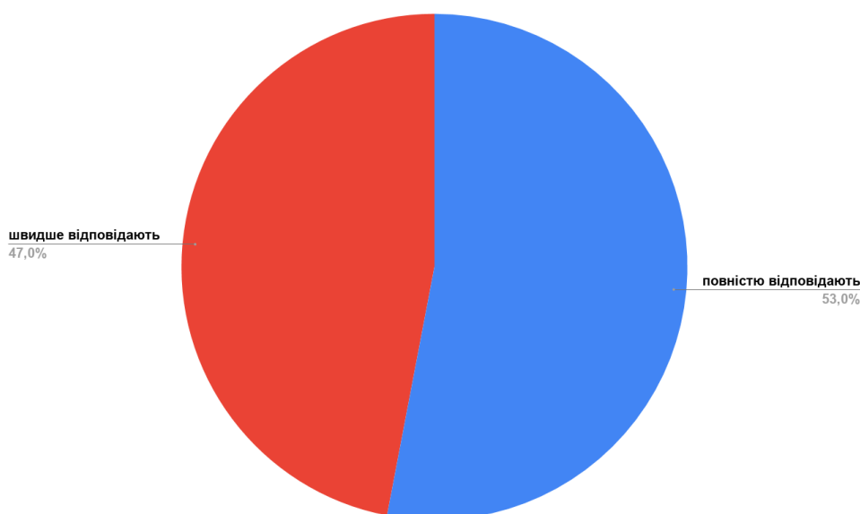
Рис. 1. Оцінювання «Наскільки знання випускника зі спеціальності відповідають сучасному реальному стану виробництва і бізнесу» (у відсотках)

Результати оцінювання науково-педагогічними працівниками якості ОПП «Публічне управління та адміністрування» за критерієм «Наскільки знання випускника зі спеціальності відповідають сучасному реальному стану виробництва і бізнесу» наведено на рисунку 1.