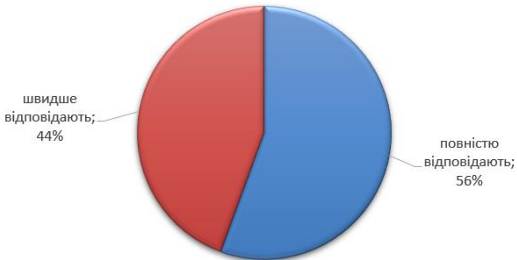
Рис. 1. Оцінювання «Наскільки знання випусника зі спеціальності відповідають сучасному реальному стану виробництва і бізнесу» (у відсотках)

Результати ранжування тринадцяти найбільш важливих компетентностей випусника для роботи за фахом (1- найбільш важлива) представлено у табл. 1.