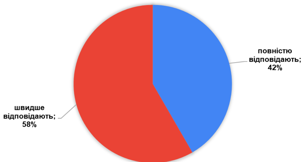
Рис. 1. Оцінювання «Наскільки знання випускника зі спеціальності відповідають сучасному реальному стану виробництва і бізнесу» (у відсотках)

Результати ранжування тринадцяти найбільш важливих компетентностей випускника для роботи за фахом (1- найбільш важлива) представлено у табл. 1.