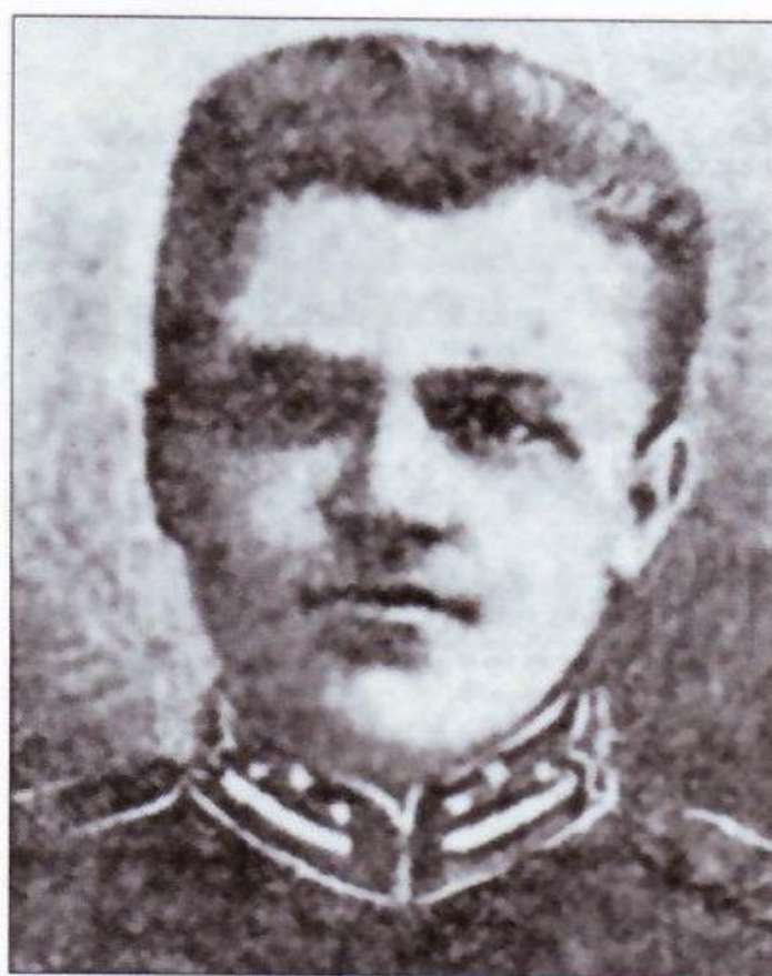
Аверкій Гончаренко, командуючий боєм під Крутами.