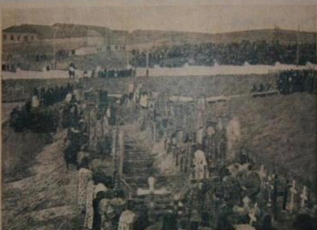
Братська могила стрільців студентів і гімназистів, забитих під Крутами.

Фото-Цинкографія друкарні Імператорського Міністерства, Надлеж. Редакційно-визначальний відділ В. М. У. Ц. Р. В. Довгожурівська 46.