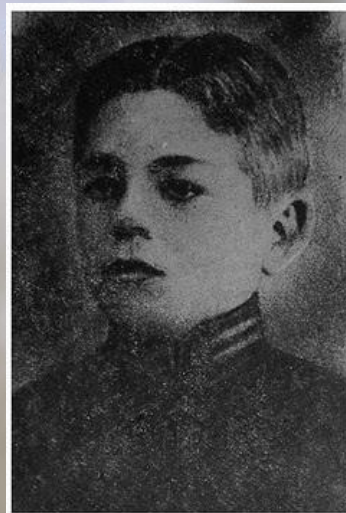
Микола Корпан загинув у бою під Крутами