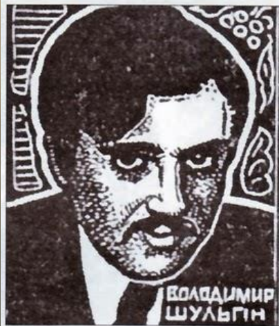
Володимир Шульгин, загинув у бою під Крутами.