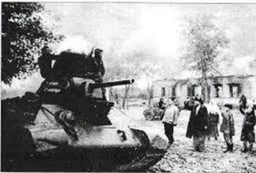
Жители Мелитополя приветствуют советских танкистов-освободителей. Октябрь 1943 года.

І ось до 20 вересня до лінії «Вотан» підійшли війська Південного фронту під командуванням генерала Ф. І. Толбухіна. За чисельністю вони в кілька разів перевищували німців: у військах було понад 350 тис. Осіб, а всього особовий склад до початку операції налічував 502 тис. Чоловік. Про те, скільки серед них було ненавчених хлопців з визволених районів, які йшли в бій з однією гвинтівкою на трьох, статистика зі зрозумілих причин замовчує.