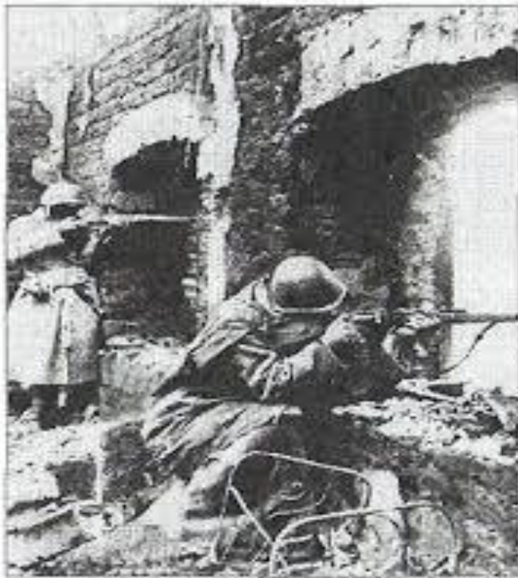
Уличные бои в Мелитополе. Октябрь 1943 года

За кілька днів боїв в Мелітополі 91-а дивізія зазнала важких втрат, і 17 жовтня командування ввело в місто 126-ю Горлівську стрілецьку дивізію. Пам'ять про подвиги її бійців досі живе в Мелітополі - це назви вулиць Абдалієва, Бейбулатова, Зиндельса, Сухова, Сопина, Фролова.