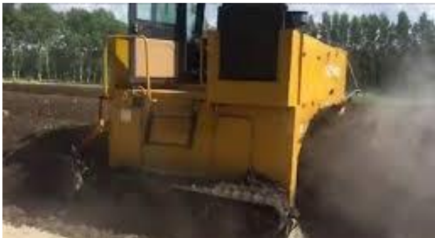
Рисунок 3. Самохідний аератор компостної суміші компанії «Zhengzhou Shunxin Engineering Equipment Co».

und Maschinenbau GmbH» (рис. 2, б) та ін. Аератори від китайський виробників представлені наприклад компанією «Zhengzhou Shunxin Engineering Equipment Co»(рис. 3) [18].