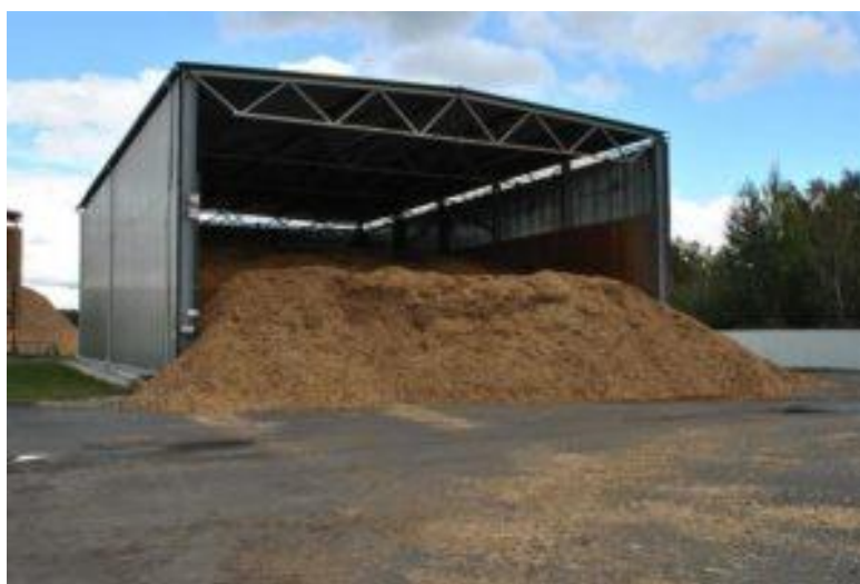
Рис. 3. Склади паливної тріски.

Деревина є гнучким джерелом енергії, яке сприяє забезпеченню стійкості різних енергетичних систем - від житлово-комунальних до промислових. Вона може використовуватися домогосподарствами з метою отримання енергії для опалення і приготування їжі. Традиційна деревина є дуже важливим джерелом енергії в багатьох державах, особливо в сільських районах, при цьому також розширюються масштаби використання деревного палива і в більш урбанізованих районах, про що свідчить збільшення споживання паливних деревних гранул на душу населення. Деревина часто використовується для цілей опалення на муніципальному рівні (рис. 1.4).