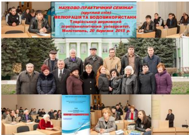
Фото-хронологія проведення науково-практичної конференції МЕЛІОРАЦІЯ ТА ВОДОВИКОРИСТАННЯ