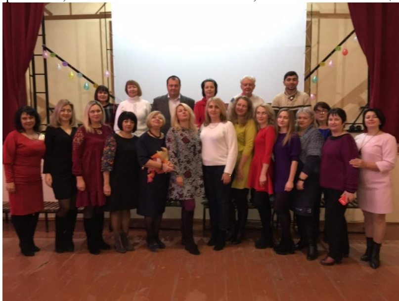
Коллектив Дніпрорудненського індустріального коледжу

Розширюються зв'язки з підприємствами-роботодавцями з метою вдосконалення виробничих навичок майбутніх спеціалістів під час практичного навчання студентів та їх подальшого працевлаштування, залучення роботодавців до навчального процесу, перегляду освітньо-професійних програм та навчальних планів. Підписані угоди про співпрацю з ПрАТ ЗЗРК, НАЕК ВП АТОМЕНЕРГОМАШ, ПАТ МОТОР СІЧ тощо.