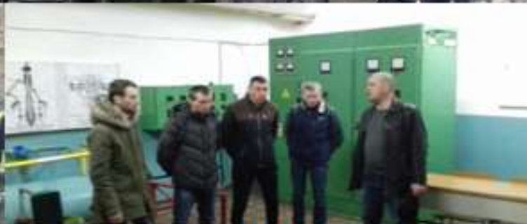
Ознайомча екскурсія для студентів факультету АТЕ і МТ факультету в рамках навчальної практики «Сільськогосподарські меліорації» в Мелітопольській технічній школі Державного агентства водних ресурсів 02.04.2019р. р.