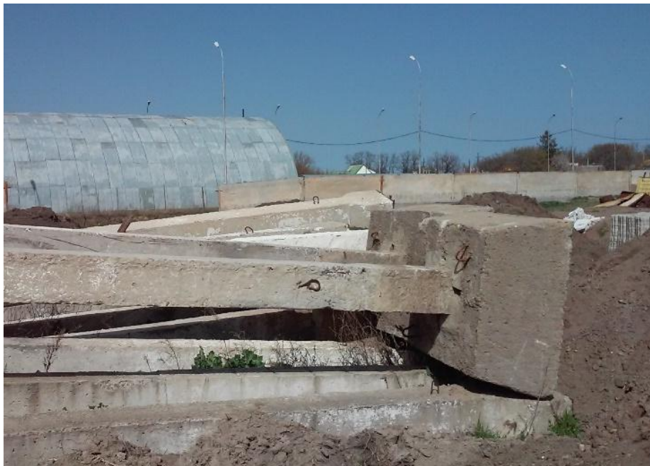
Фото 1. Загальний вигляд фундаменту

Колона замонолічена у збірний залізобетонний фундамент стаканного типу, який складається із підколонника зі «стаканом» (фото1). Схема розміщення колон представлена на рис. 1.