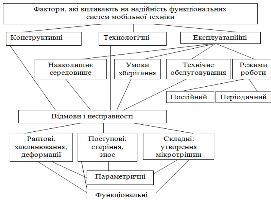
Рис.2. Схема факторів, які впливають на надійність функціональних систем сільськогосподарської техніки

Фактори, які впливають на надійність функціональних систем мобільної техніки наведені на рис.2.