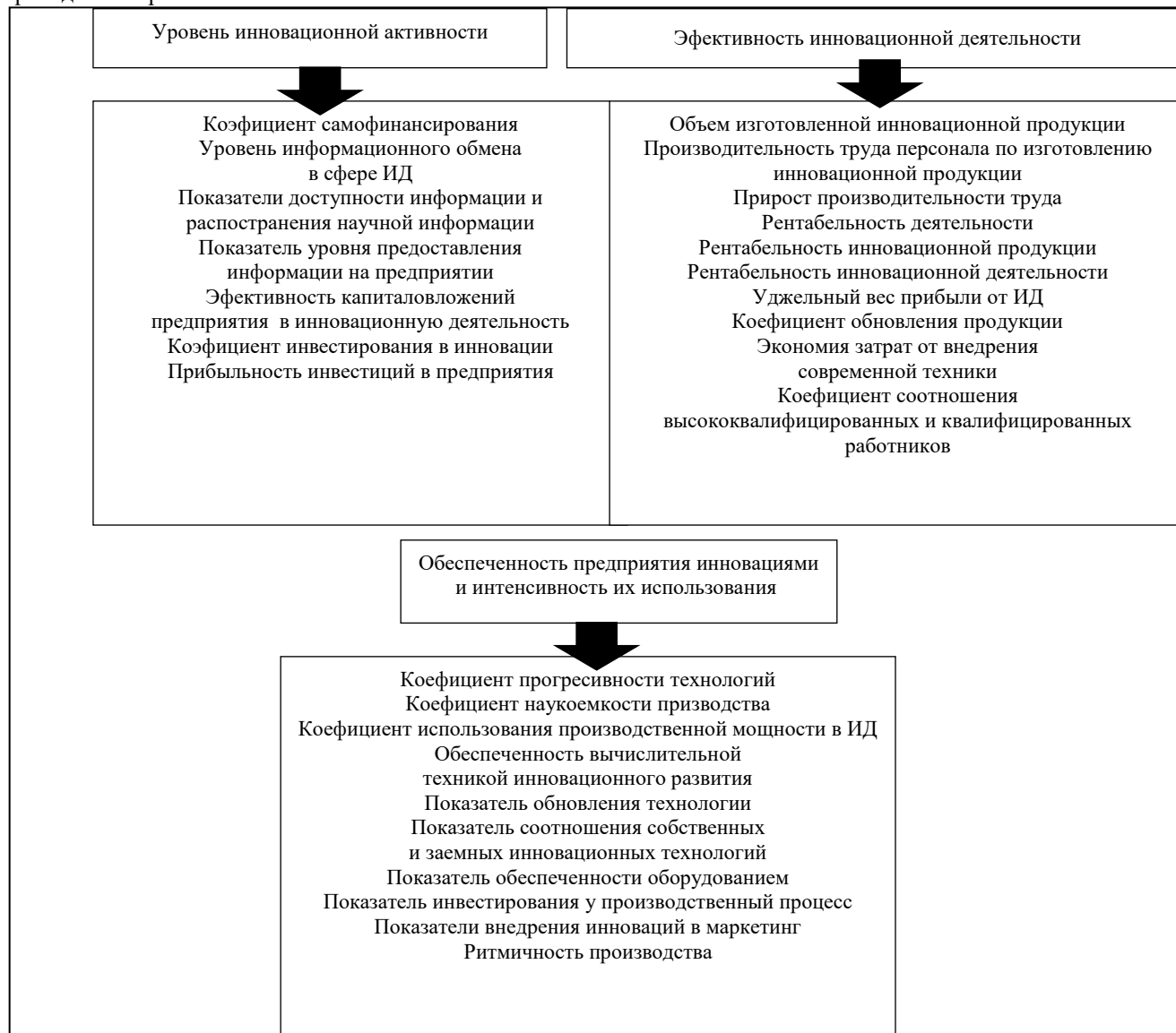
Рис. 1. Показатели расчета определенных параметров общего уровня инновационной деятельности на промышленном предприятии

Эффективность инновационной деятельности предусматривает определение способности предприятия к производству инновационной продукции и характеризуется анализом темпов производства новой продукции, определением целесообразности производства той или другой продукции, необходимостью направления средств в инновационное развитие, эффективности работы маркетинга по сбыту определенного типа и вида продукции, размеров дохода от результатов инновационной деятельности (ИД) и выручки от реализации инновационного типа продукции, суммы расходов на проведение ИД. За приведенной группой существуют возможности относительно оценки уровня поддержки государством инновационной деятельности предприятий и основные показатели приведены на рис. 1.