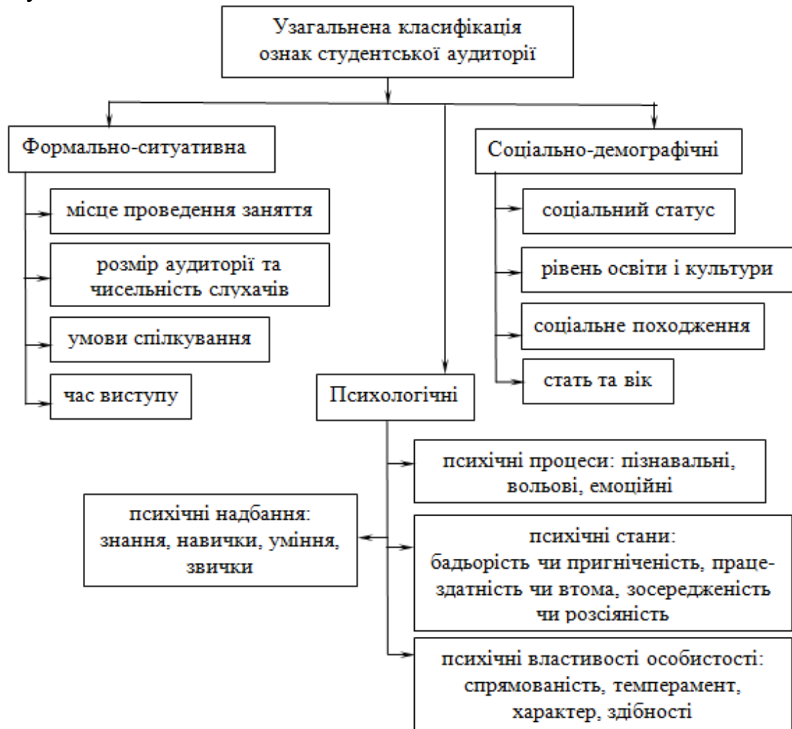
Рис. 2. Узагальнена класифікація ознак студентської аудиторії при взаємодії викладача та студентів

Авторами статті розроблена узагальнену класифікація ознак студентської аудиторії при взаємодії викладача та студентів, яка наведена на рисунку 2.